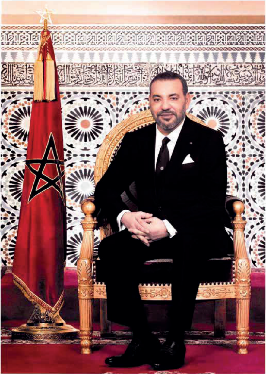
Sa Majesté le Roi Mohammed VI, que Dieu L'assiste